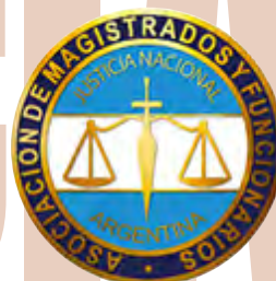
MINISTERIO PÚBLICO DE LA DEFENSA