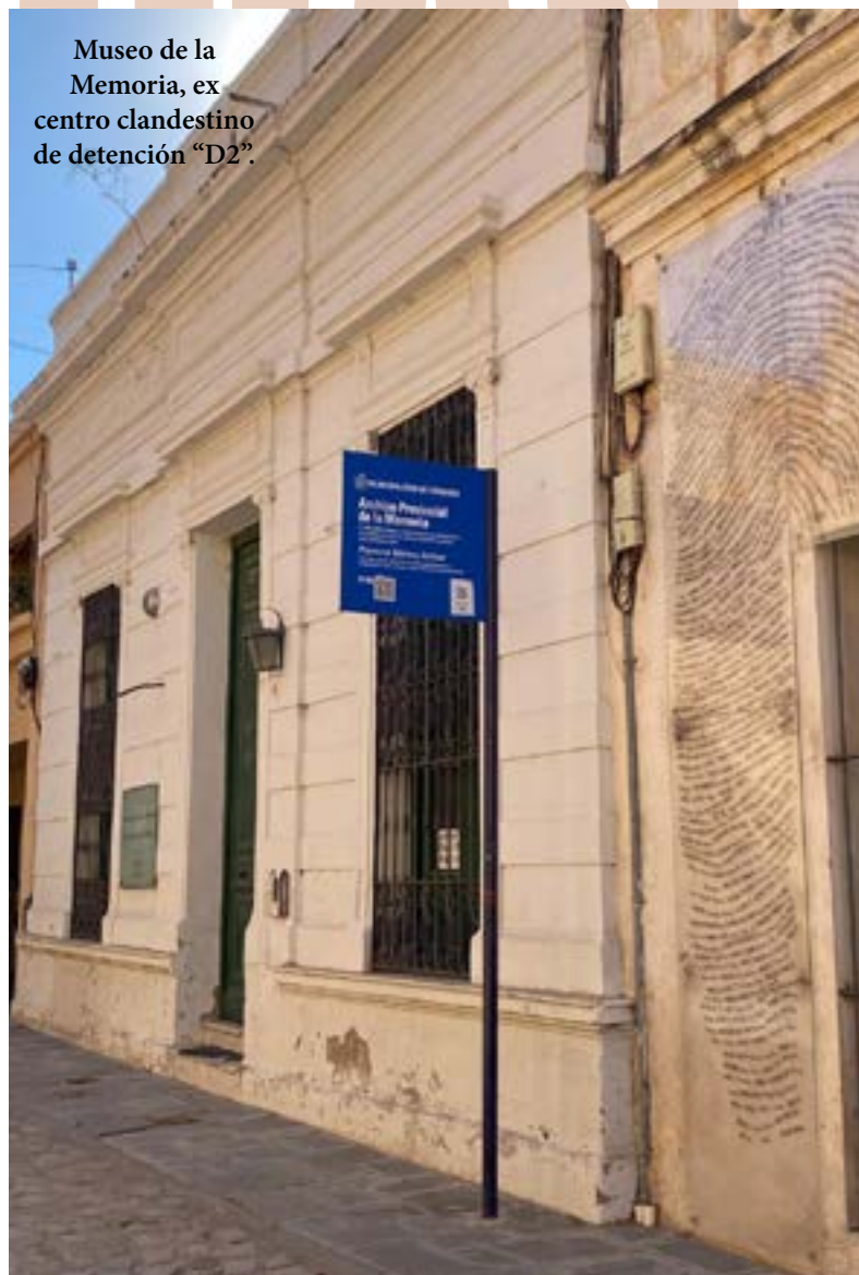
Museo de la Memoria, ex centro clandestino de detención "D2".

percibir el sostenimiento de las políticas públicas de Memoria, Verdad y Justicia en la Provincia, y la consecuente enseñanza que dejaron todos los juicios por violación de los DDHH durante la dictadura cívico-militar-eclesiástica que tramitaron allí y en todo el país: un rotundo NO a la violencia política, que forma parte esencial del pacto Democrático, que debe protegerse por nuestro futuro y el de nuestro país. Nos sorprendió gratamente, que llegaron micros con estudiantes secundarios a hacer una visita con su profesora, porque confirma el sostenimiento de las políticas públicas en este tema de DDHH" .