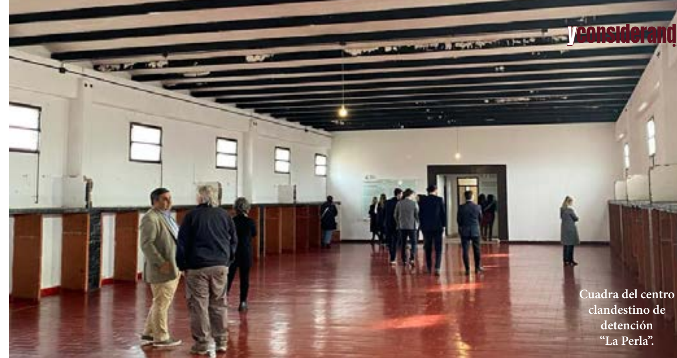
Cuadra del centro clandestino de detención "La Perla".

moria, donde los integrantes de la Comisión compartieron instancias de diálogo con las autoridades de cada institución. Además, se llevó a cabo una reunión formal de la Comisión y actividades de camaradería con representantes de la comunidad cordobesa.