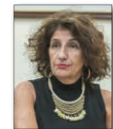
* Directora del Instituto de la Magistratura de la AMFJN.

En el aula escolar y de cara a la ciudadanía, el Programa La Justicia va a la Escuela abreva en aquel interés acerca de “¿Qué Justicia quiere la sociedad?” ▲