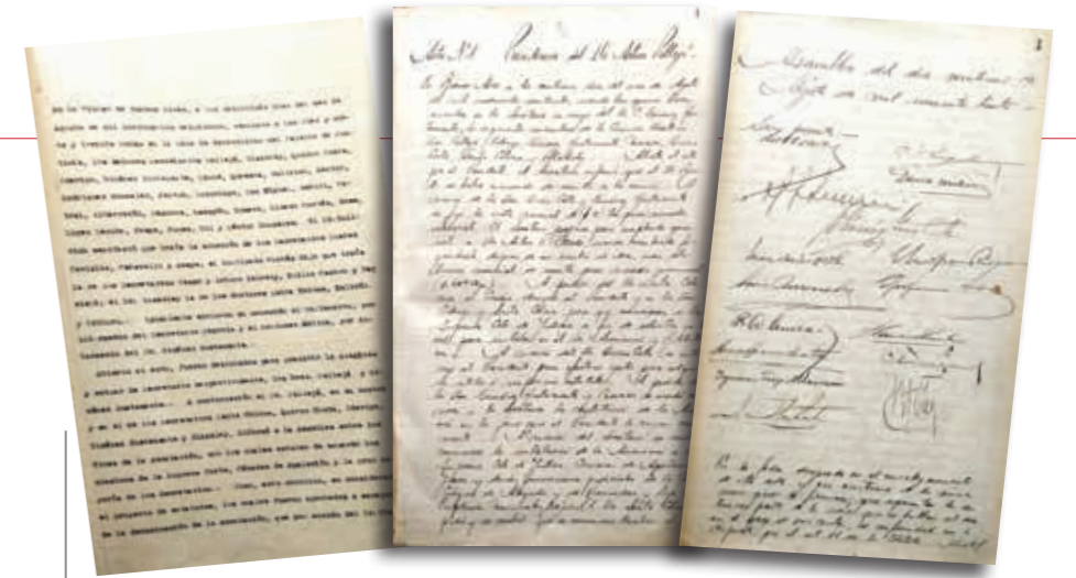
Facsimiles de las primeras actas de la AMFJN.

dos, manteniéndose la acotación para con sus miembros hacia aquellos con asiento funcional en la ciudad capital de la República.