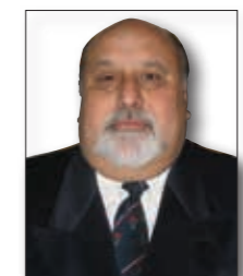
* Juez de Cámara del Tribunal Oral en lo Criminal Federal de General Roca.