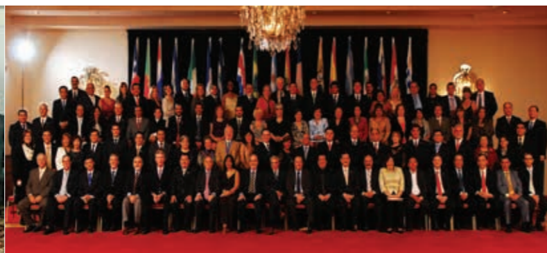
Asamblea General de la FLAM y Reunión del Grupo Iberoamericano de la UIM en Buenos Aires, 2007. A la derecha, el congreso de la FLAM en 2010.

juzgados y órganos del Poder Judicial de la Nación a la Ciudad traería aparejados graves perjuicios, y que no debía permitirse un injustificado desmembramiento.