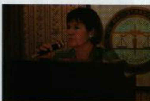
Dra. Elena Highton de Nolasco