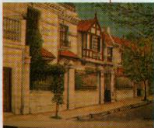
"Pasaje Ferrari" (Barrio Ingles - Caballito) -acuarela 0,34 x 0,25 cm.- Enero 2006

A partir de esa época su actividad artística se orientó hacia el desarrollo de las técnicas pictóricas