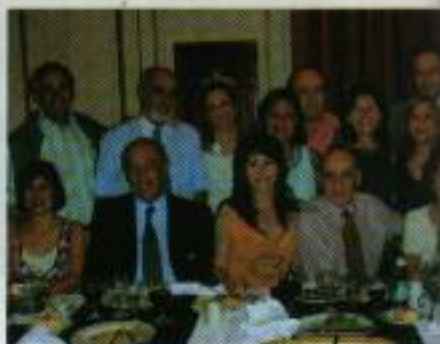
Cena de fin de año con los Asociados-bailarines de Tango

Esperamos que esta visión del tango nos sirva para inspirar el inicio o la continuidad de caminos de mejoramiento y transformación. No importa el género, la edad, la profesión, el sistema de creencias, o el estado físico...el tango, también llamado "la danza del