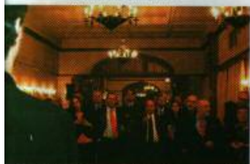
Asociados frente a uno de los integrantes del Grupo Gala Lirica