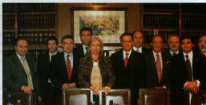
Autoridades de ambas instituciones

en el exterior y del que habrá de desarrollarse en el mes de septiembre u octubre de este año en la Republica Argentina, con el objeto de posibilitar y fomentar la concurrencia de los interesados en participar en estas actividades.