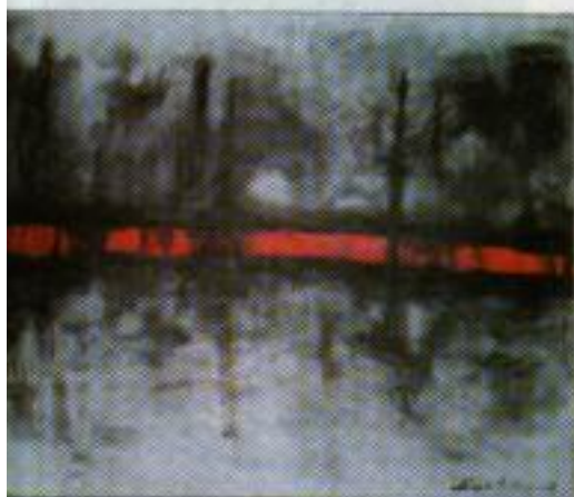
"pantano" - 0,80 x 0,70 cm. - acrílico