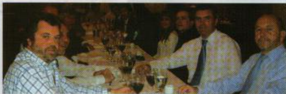
Cena en la sede de la AMFJN