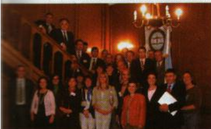
Asistentes al seminario

a todos para sumarse en el desafío de trabajar para obtener los cambios desde el propio Poder Judicial.