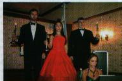
El grupo Gala Lírica