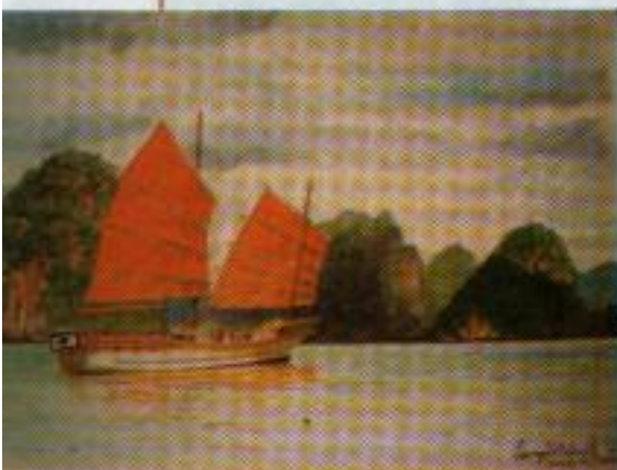
"Phang Nga Bay" (Tailandia)