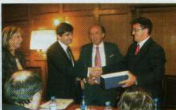
Firma del convenio en las que intervinieron autoridades de ambas instituciones