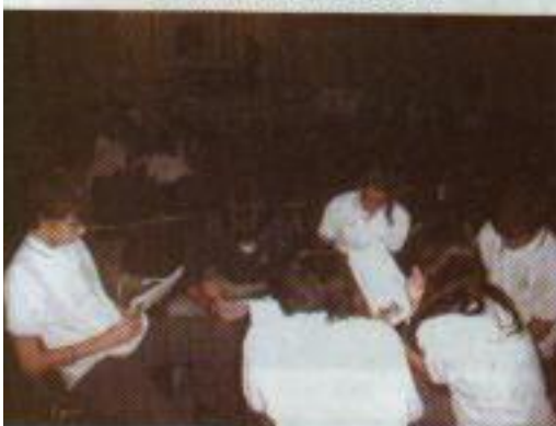
alumnos trabajando en los talleres