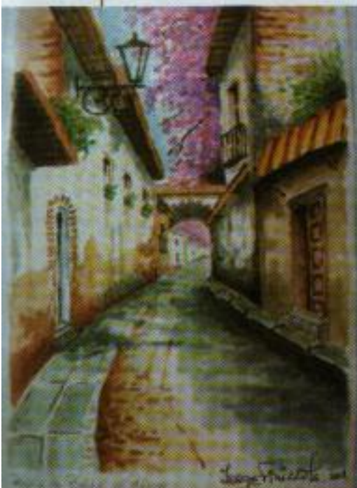
"Pasajes" (México DF) - acuarela 0,50 x 0,35 cm. - 2008

Carrera Judicial: 41 años de Justicia Laboral (1965/1975 : Distintos cargos escalafonarios;