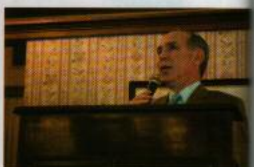
Dr. Ricardo Lorenzetti