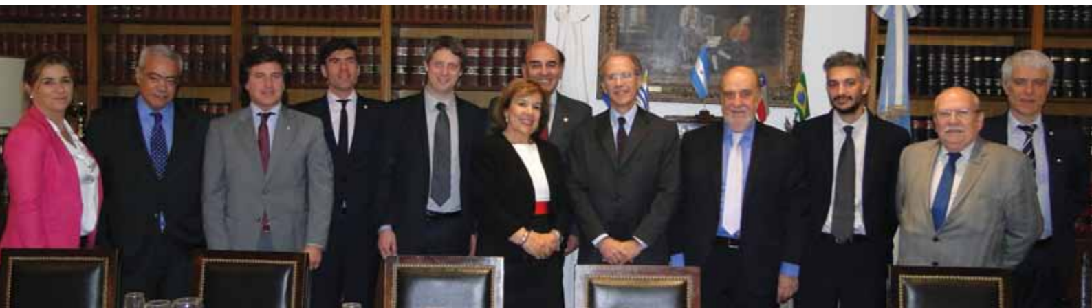
Directivos y ex directivos de la AMFJN junto a Rosenkrantz y sus colaboradores, en la sede de la AMFJN.

El nuevo juez de la Corte Suprema almorzó en la AMFJN con miembros del Consejo Directivo, y mostró su vocación de trabajar a favor de un mejor servicio de justicia.