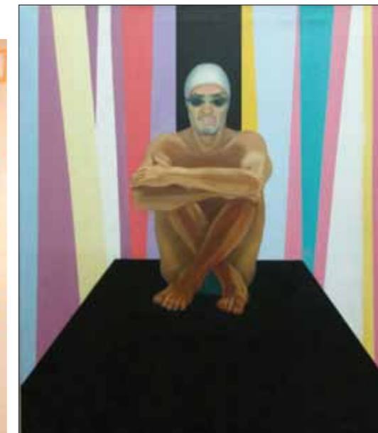
Titulo: "Tocando fondo" 0,70 x 0,50cm. Técnica mixta sobre tela

guardar ideas, sueños, sonidos, palabras, movimientos. Se guardan para el futuro, permiten vivir en nuestro presente y, cada vez que una necesidad de ellos, ahí se encuentran. Lo que es auténtico y libre es permanente, fluye, se va y vuelve, pero cada vez que nos queremos expresar y comunicar está", sintetizó al inaugurar su exhibición.