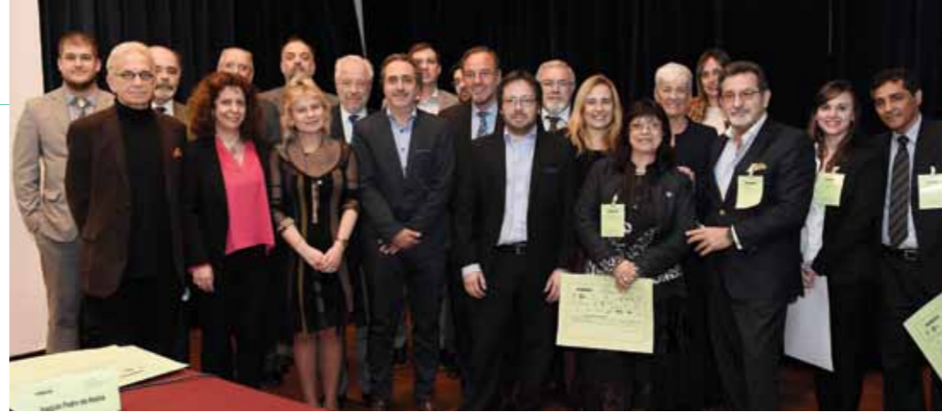
Los expositores y panelistas que se dieron cita entre el 10 y el 12 de agosto en la Facultad de Derecho de la UBA.

dial, transformó los contenidos y la recíproca relación entre la ley y la Constitución.