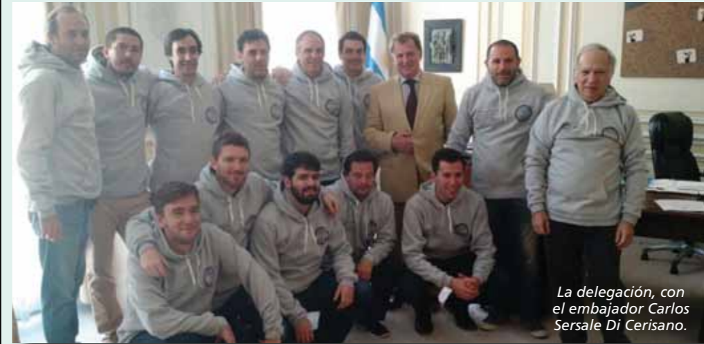
La delegación, con el embajador Carlos Sersale Di Cerisano.

En su despacho oficial, el diplomático expresó su beneplácito por este tipo de actividades que ponen en contacto a las sociedades civiles de ambos países y son, según sus expresiones, las que contribuyen al fortalecimiento de las relaciones bilaterales entre los estados nacionales. Luego, con otros miembros de la Embajada se habló de cuestiones propias de la labor jurisdiccional y se dejó abierto un canal de diálogo para la gestión de intereses comunes.