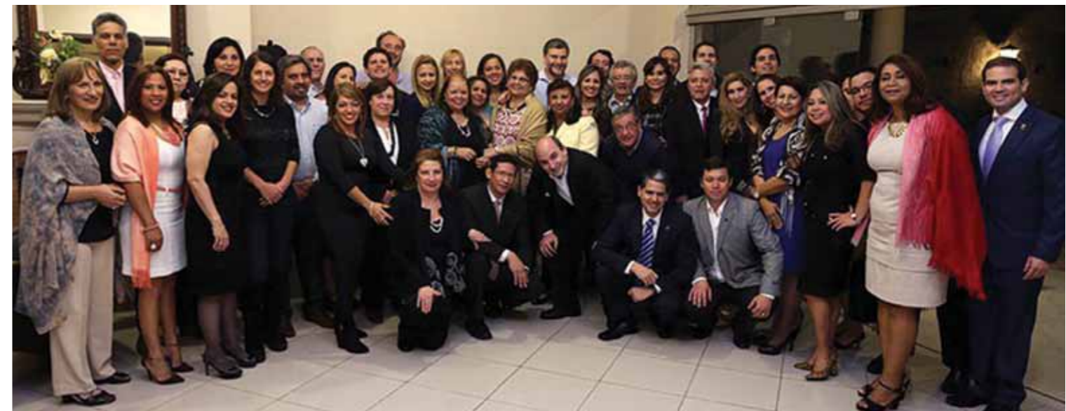
Los representantes de los distintos países que se dieron cita en Asunción.

Entre otros puntos, los principios establecen que "el trabajo de los Defensores Públicos Oficiales constituye un aspecto esencial para el fortalecimiento del acceso a la justicia y la consolidación de la democracia" y que "los Estados tienen la obligación de eliminar los obstáculos que afecten o limiten el acceso a la defensa pública, de manera tal que se asegure el libre y pleno acceso a la justicia". ▼