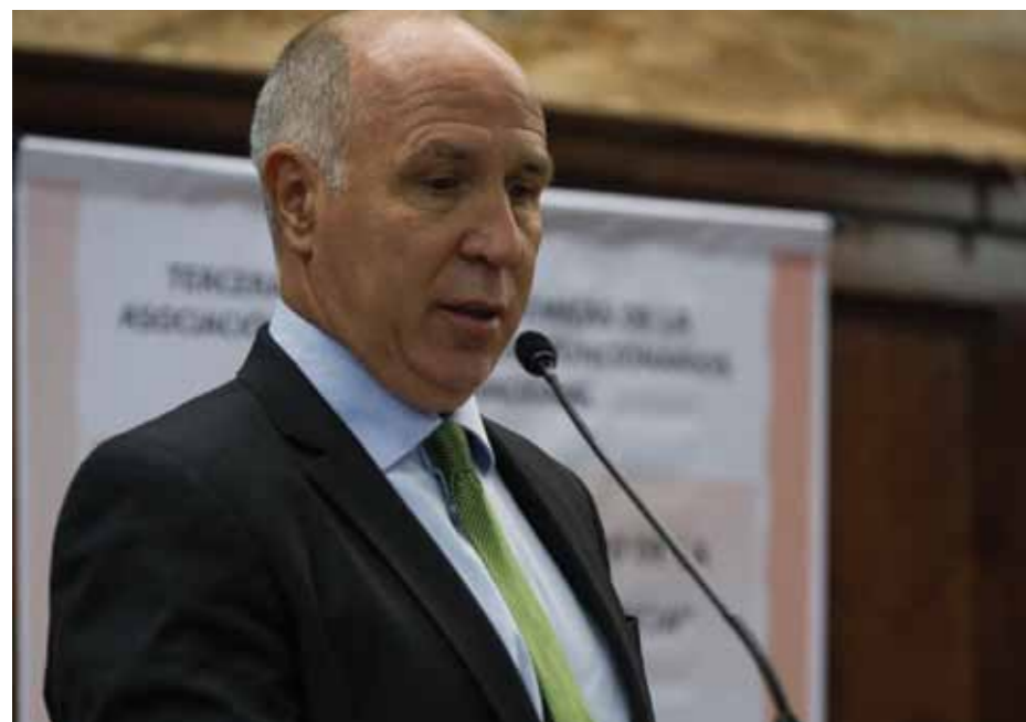
Ricardo Lorenzetti, presidente de la Corte Suprema de Justicia de la Nación.

aplicar las leyes. Hay roces con otros poderes, sentencias que avanzan más o menos, y muchas veces se dice que hacemos activismo judicial, pero se trata de aplicar las normas. No debemos pensar que los jueces deben conformar a las mayorías. Si así fuese, retrocederíamos a la Edad Media. Nunca vamos a tener jueces independientes y aprobados por las encuestas. Siempre hay alguien que queda disconforme. La sociedad va a valorar el prestigio del Poder Judicial porque se comporta con coherencia, previsibilidad e imparcialidad”.