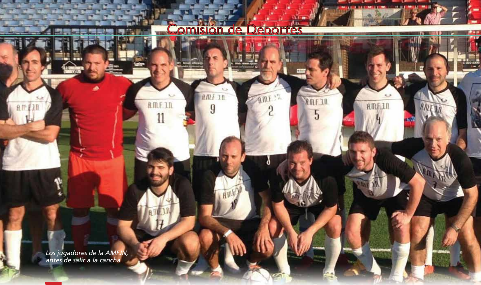
Los jugadores de la AMFJN, antes de salir a la cancha