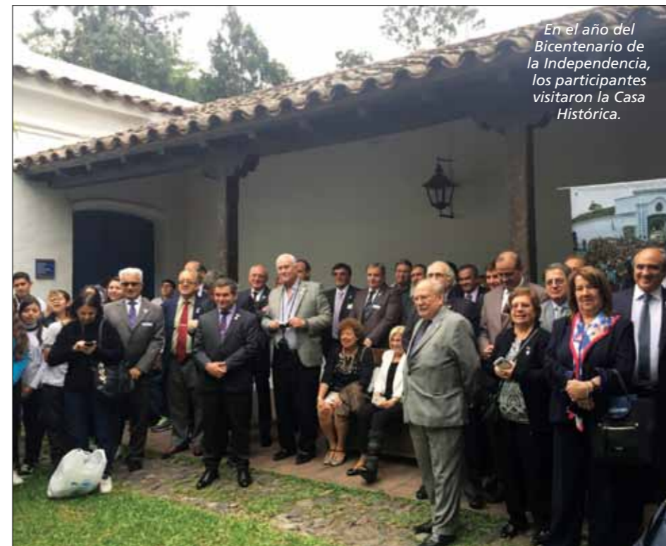
En el año del Bicentenario de la Independencia, los participantes visitaron la Casa Histórica.