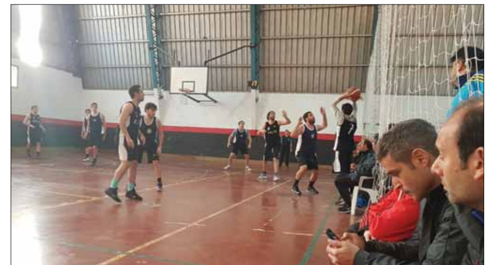
El básquetbol fue otras de las disciplinas en las que participó la AMFJN en Necochea.

Los equipos de fútbol estuvieron cerca de