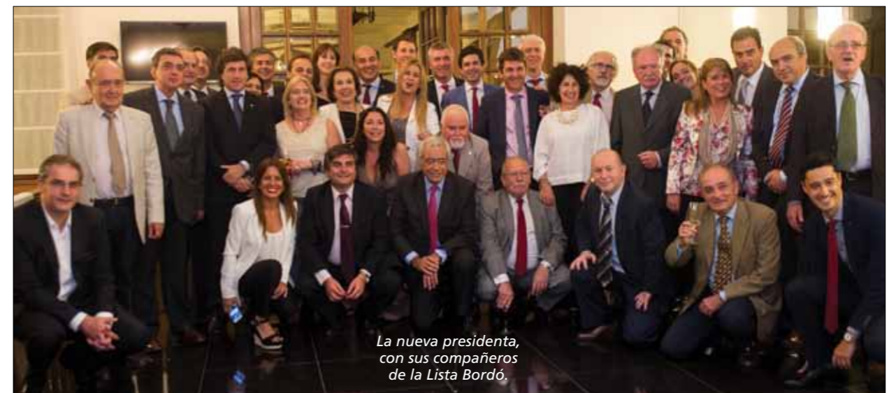
La nueva presidenta, con sus compañeros de la Lista Bordó.

tificó su postura de rechazo firme a la forma en que se pretendió instrumentar durante 2016 el traspaso de la Justicia Nacional a la jurisdicción de la Ciudad Autónoma de Buenos Aires, cuando contó: “Me llamó el ministro de Justicia, Germán Garavano, para felicitar me. Yo le dije que vamos a trabajar juntos pero también nos vamos a pelear, porque nosotros vamos a impedir que la Justicia Nacional se desmembre. Todos conocen mi postura, que es la que siempre he tenido”.