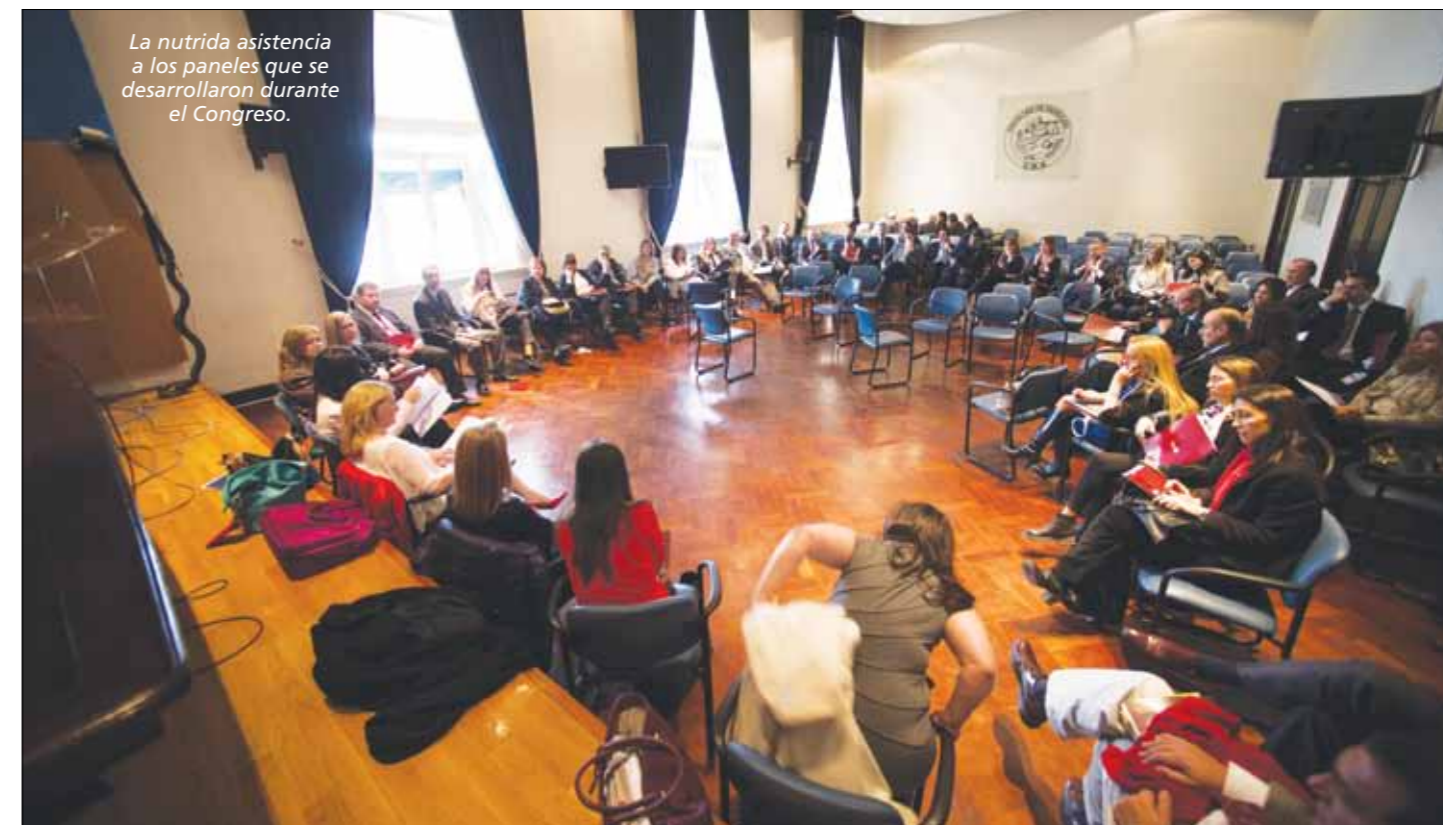
La nutrida asistencia a los paneles que se desarrollaron durante el Congreso.

9) Retomar las actividades de la Comisión de Peritos dentro de la Asociación. ▼