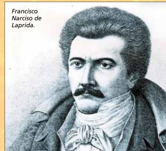
Francisco Narciso de Laprida.

Se perfeccionó con ello la Declaración de nuestra Independencia Nacional. Que todo ello forme parte de nuestra emotiva recordación. ▼