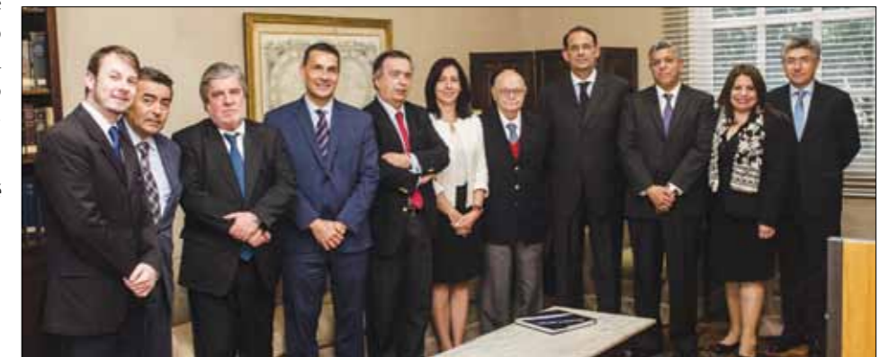
La reunión del Comité Jurídico Interamericano (CJI).

integral y autónoma, que es una herramienta fundamental para la protección de los derechos humanos de todas las personas, en especial de aquellas más vulnerables.