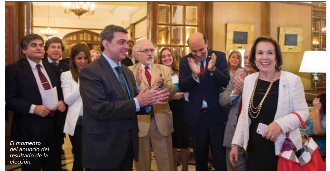
El momento del anuncio del resultado de la elección.

dependencia del Poder Judicial y de impulso a la capacitación de sus socios.