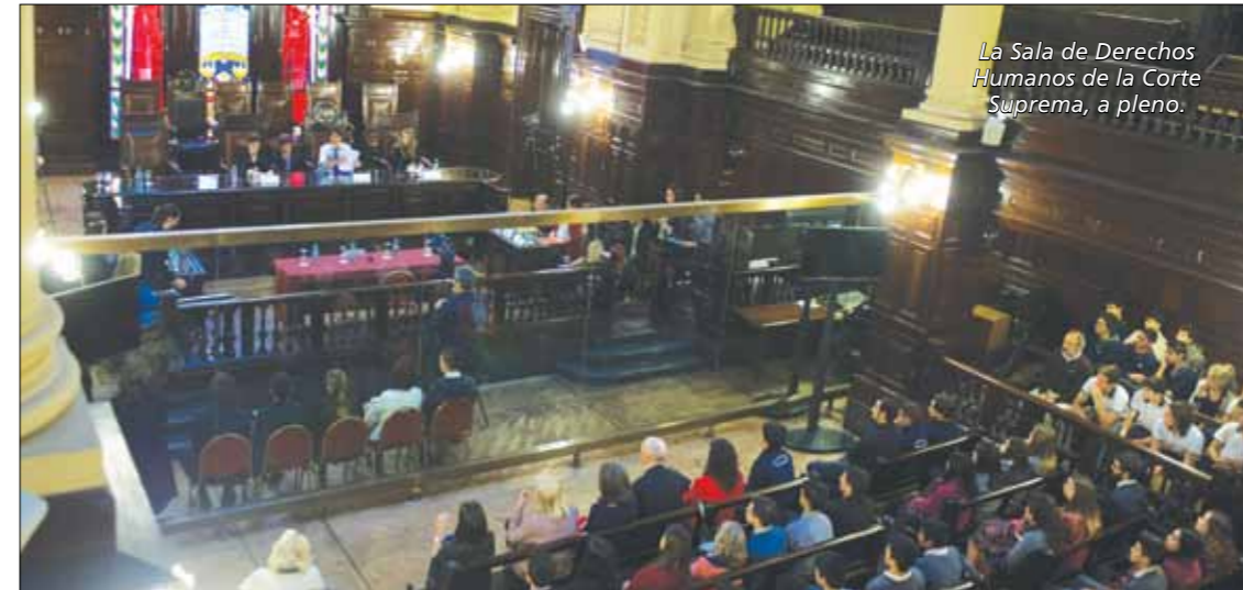
La Sala de Derechos Humanos de la Corte Suprema, a pleno.

Tras haber sido partícipes de La Justicia va a la Escuela durante todo el año, los estudiantes desarrollaron un juicio crítico que les permite distinguir la condena social, de la mediática y la judicial, con varios de sus compañeros y alumnos de otras escuelas que siguieron desde sus asien-