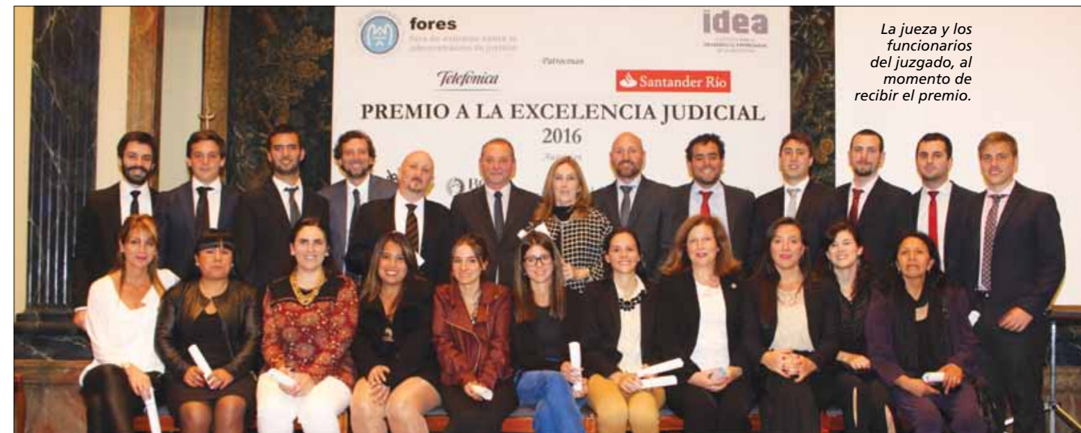
La jueza y los funcionarios del juzgado, al momento de recibir el premio.

si yo, personalmente, puedo, todos pueden, no importa el tiempo que tome. No renuncio a nada porque genere más trabajo. De hecho, estoy siempre dispuesta a hacer las pruebas piloto de las distintas tendencias que van surgiendo en el servicio de Justicia”.