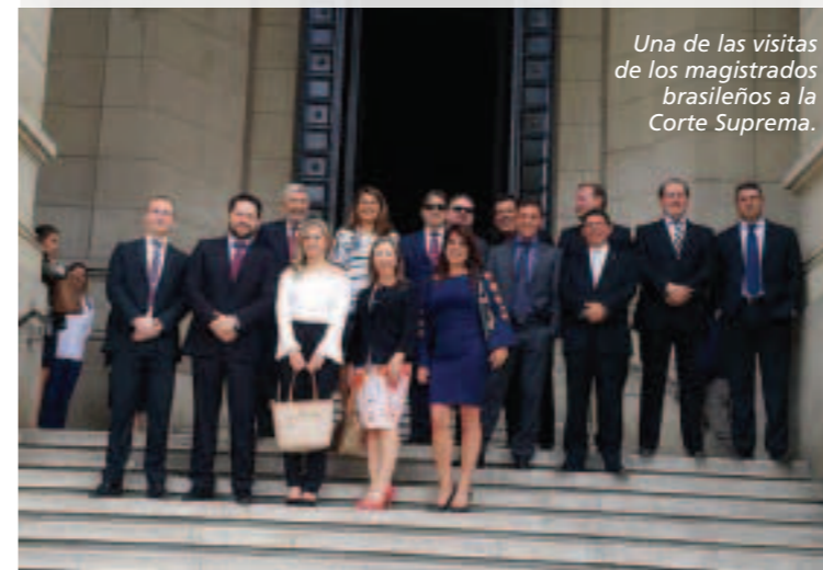
Una de las visitas de los magistrados brasileños a la Corte Suprema.