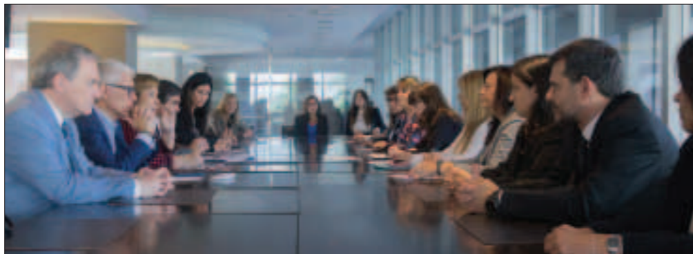
La Mesa Directiva intercambió las experiencias institucionales desarrolladas durante este año.