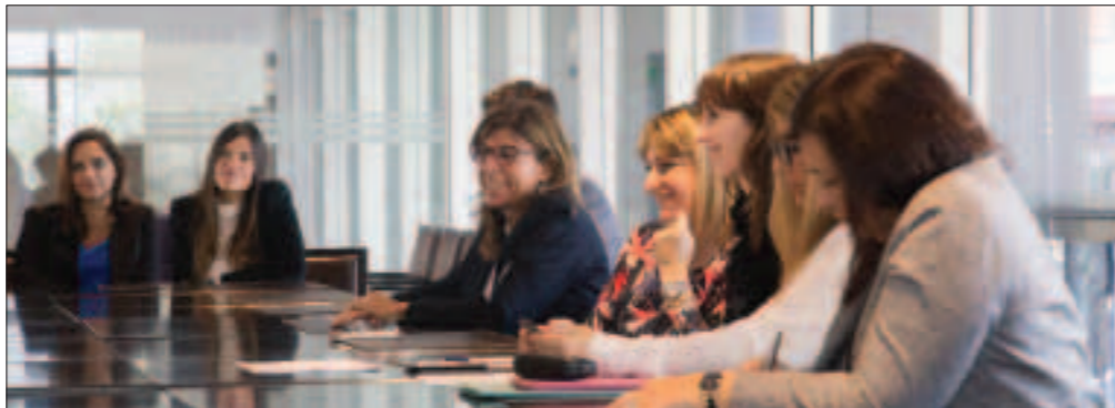
Las reuniones en distintas provincias se darán de manera habitual en los próximos meses.