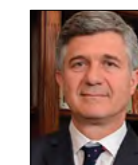
* Consejero Juez del Consejo de la Magistratura del Poder Judicial de la Nación

Como queda ya dicho, estamos más que dispuestos al diálogo para afrontar conjuntamente las dificultades que atraviesa el país. Pero es con ese mismo nivel de compromiso que vamos a defender nuestro sistema de Justicia y a sus integrantes, quienes cumplen su función con orgullo y tenacidad aún en condiciones precarias de trabajo. 🌱