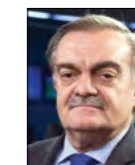
* Juez de la Sala II de la Cámara Federal de San Martín Presidente del Consejo de la Magistratura de la Nación

Por eso entendemos que las cosas pueden hacerse de otra manera para que en última instancia la gente no se vea perjudicada con la afectación del servicio de justicia. Me preocupa muy especialmente la respuesta que le estamos dando a la ciudadanía porque sabemos que el Poder Judicial no está funcionando como debería y como queremos que funcione. Pero si esta ley se concreta se producirá un impacto importante. En mi rol de presidente del Consejo de la Magistratura se me planteará un problema muy complejo. Y siempre pedimos que una cuestión tan delicada se resuelva a partir de un diálogo de calidad. ✿