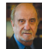
* Vicepresidente del Consejo de la Magistratura del Poder Judicial de la Nación Ex presidente de la Asociación de Magistrados y Funcionarios de la Justicia Nacional

Hoy existen unas 250 vacantes en el Poder Judicial y, razonablemente, se pueden generar otras 250, por lo que el Poder Judicial quedaría con un 50% de sus cargos cubiertos. Si a esto se le sumara una modificación de la ley de subrogancias, que permitiera evitar la exigencia del acuerdo del Senado, el Poder Ejecutivo podría nombrar subrogantes fácilmente y, en menos de un mes, cubrir las 500 vacantes, con la justificación de la emergencia. No tendríamos, por supuesto, los jueces independientes que tenemos hoy. 🌱