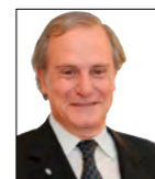
* Defensor Público de Menores e Incapaces. Vicepresidente de la AMEJN Secretario General de AIDEF